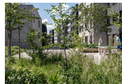
Wohnüberbauung Strahmmatte, CH Projektzeitraum: 2017-2024 Fläche: 8.100 m 2