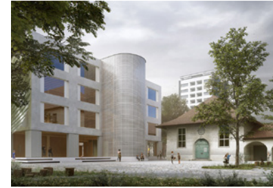
Erweiterungsneubau Volksschule Breitfeld Planung: seit 2025 Fläche: 9.800 m 2