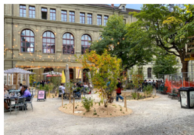
PROGR Umgestaltung Hof, Bern | CH Projektzeitraum: 2024-2026 Fläche: 880 m 2