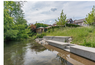
Ortsumitte Margaretenstraße Krailling, D Projektzeitraum: 2015-2022 Fläche: 16.700 m 2