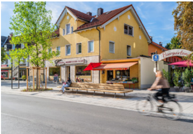
Neugestaltung Truderinger Straße München, D Projektzeitraum: 2018-2022 Fläche: 11.000 m 2 polis award 2025, 3. Platz