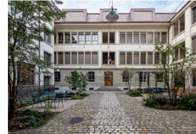
Innenhof la Centrale Bienne, CH Projektzeitraum: 2020 Fläche: 1.500 m 2