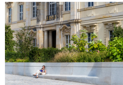
Umfeld Humboldt Forum Berlin, D Planungszeitraum: 2013-2022 Fläche: 36.500 m 2 Natursteinpreis 2022