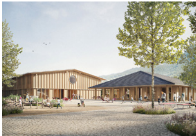
Extension de l'école primaire de Broc, CH Planung: seit 2024 Fläche: 3.500 m 2