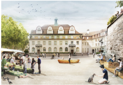
Obstmarkt Herisau, CH Planung: seit 2020 Fläche: 7.000 m 2 Planungspartner: Büro Dudler