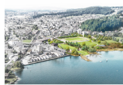
Seefeld Horw, CH Planung: seit 2020 Fläche: 7.500 m 2 Planungspartner: Joos & Mathys