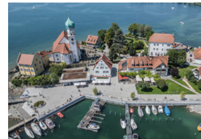
Halbinselanierung und Uferzone Wasserburg (Bodensee), D Projektzeitraum: 2014-2025 Fläche: 6.000 m 2