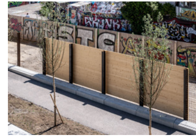
Gaswerkareal, Schulhausprovisorium Bern, CH Projektzeitraum: 2023-2025 Fläche: 1.200 m 2