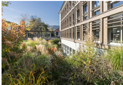
Volksschule Manuel Bern, CH Projektzeitraum: 2016-2021 Fläche: 19.000 m 2 Planungspartner: dad Architekten