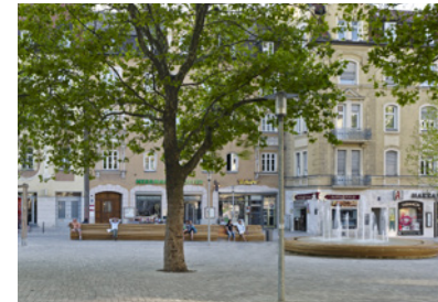
Neugestaltung 'Am Harras' München, DE Projektzeitraum: 2008-2013 Fläche: 10.000 m 2 Planungspartner: Atelier PK Architekten