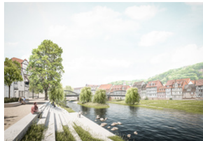
Fuldaufer in Rothenburg an der Fulda, D Planung: seit 2021 Fläche: 20.550 m 2