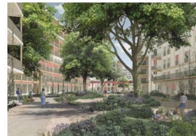
Entwicklung WIFAG Areal, CH Planung seit: 2021 Fläche: 16.400 m 2