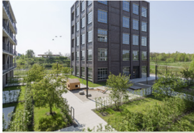
Wohnumfeld Lindenauer Hafen Leipzig, D Projektzeitraum: 2018-2021 Fläche: 3.700 m 2 Planungspartner: W&V Architekten