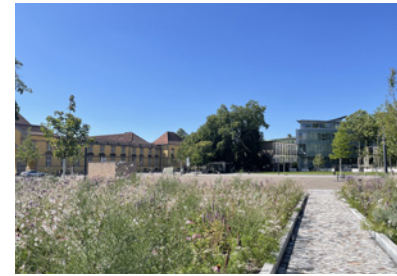
Ledenhof und Neuer Graben in Osnabrück, D Projektzeitraum: 2020-2025 Fläche: 20.000 m 2 Planungspartner: Obermeyer Infrastruktur