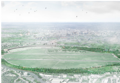
Entwicklung Tempelhofer Feld Berlin, D Wettbewerb: ein Preisträger von 6, 2025