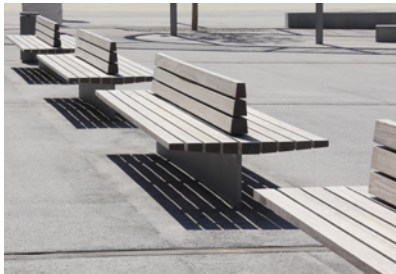
Produktentwicklung Bank 'duplus' Hersteller: Michow & Sohn red dot award 2015