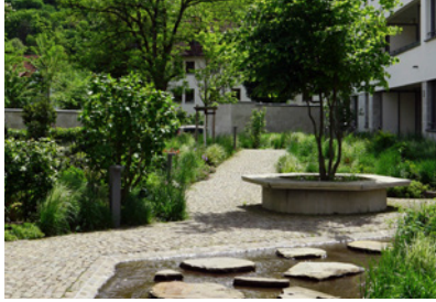
Schladerer Areal Staufen, D Planung: 2018-2021 Fläche: 4.800 m 2