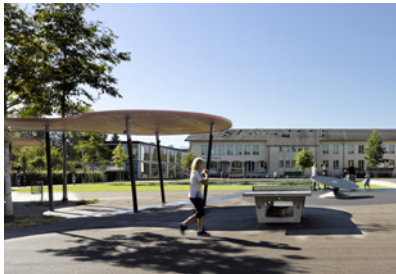
Erweiterung Schulanlage 'Untere Au' Heimberg, CH Projektzeitraum: 2012-2015 Fläche: 10.900 m 2 Planungspartner: Lanzrein Partner Architekten