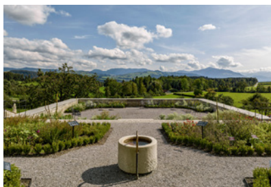
Umfeld Kloster Kappel Kappel am Albis, CH Planung: seit 2013 Fläche: 13.500 m 2 Planungspartner: Atelier Kempé Thill