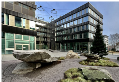
Ehemaliges Postareal Freiburg, D Projektzeitraum: 2013-2020 Fläche: 9.000 m 2