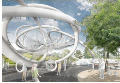
IGA Metropole Ruhr 2027 'Emscher Nordwärts', D Planung: seit 2020 Fläche: 200.000 m 2 Planungspartner: Wetzel & von Seth Ingenieure, W&V Architekten