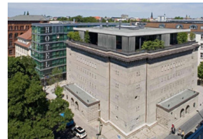
Dachterrasse Sammlung Boros Berlin, D Projektzeitraum: 2005-2006 Fläche: 1.600 m 2 Planungspartner: realarchitektur