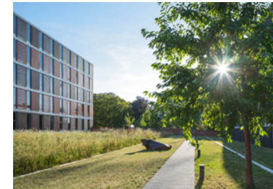
Erweiterung Landratsamt Ludwigsburg, D Projektzeitraum: 2013-2018 Fläche: 4.000 m 2 Planungspartner: Kubeneck Architekten