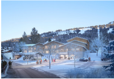
Talstation Schönried, CH Planung: seit 2025 Fläche: 9.000 m 2