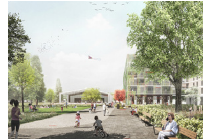
Städtebaulicher Entwurf Rochdale Barracks Bielefeld, D Projektzeitraum: 2022-2023 Fläche: 108.000 m 2 Planungspartner: Studio Schultz-Granberg