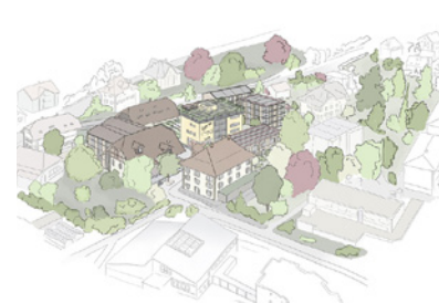
Areal Braui Worb, CH Planung: seit 2024 Fläche: 5.000 m 2