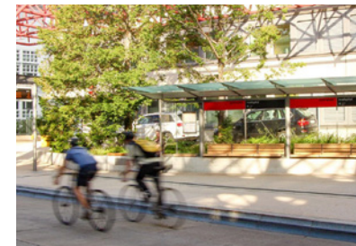
Umfeld Inselspiral Bern, CH Projektzeitraum: 2012-2016 Fläche: 3.900 m 2 Planungspartner: bauzeitarchitekten