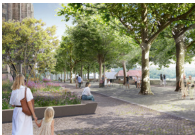
Klimagerechte Neugestaltung Stadtbalkon und Wegenetz Marburg, D Planung: seit 2025 Fläche: 5.000 m 2