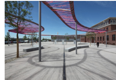
Graf-de-Chardonnet-Platz Kelsterbach, D Projektzeitraum: 2012-2014 Fläche: 7.000 m 2