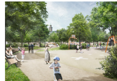
Parkanlage Bergemanns Hof Herne, D Planung: seit 2023 Fläche: 29.000 m 2